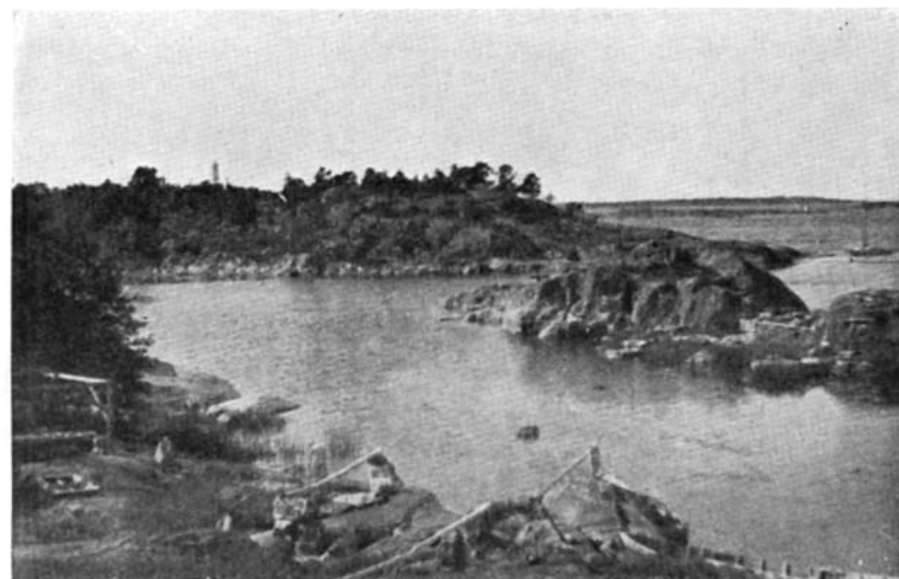
29. byggdes engång på havsomsvallade uddar. — Salmen.