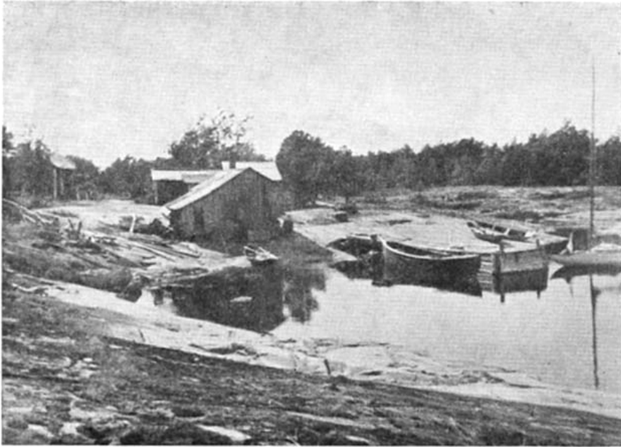
30. Engång skall kanske också detta lilla fiskläge ligga omgivet av . .