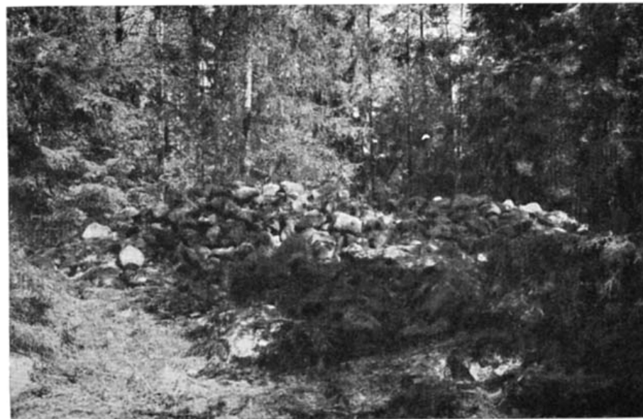
28. Bronsåldersgravarnas stenkummel, som nu ligga högt uppe i land