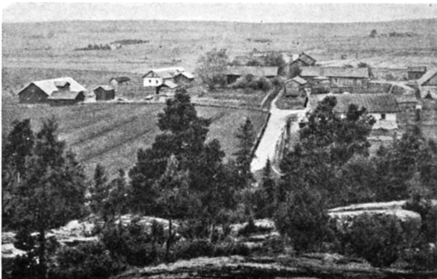
31. . . gårdar på en bördig slätt. Järvö hamn (ovan) och Berg by i Degerby.